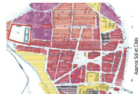
Étude urbaine sur Montauban « Typologie de l'occupation du sol sur les deux quartiers de Sapiac et Villebourbon. »

Le taux de financement maximum est de 50 % (études), 40 % (travaux de prévention) et 25 % (travaux de protection).